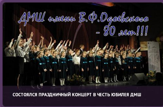
СОСТОЯЛСЯ ПРАЗДНИЧНЫЙ КОНЦЕРТ В ЧЕСТЬ ЮБИЛЕЯ ДМШ